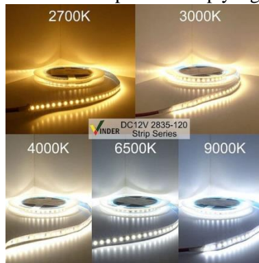
GAMBAR: ILUSTRASI LED STRIP