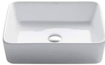
GAMBAR: ILUSTRASI WASTAFEL