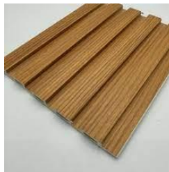
GAMBAR: ILUSTRASI PILIHAN WPC

Material WPC yang digunakan setara dengan WPC ULTIMATE.