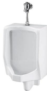
GAMBAR: ILUSTRASI URINOIR