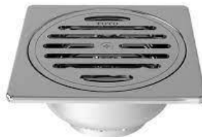
GAMBAR: ILUSTRASI FLOORDRAIN