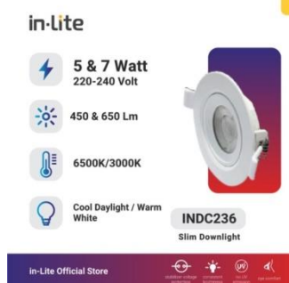
GAMBAR: ILUSTRASI LED DOWNLIGHT