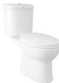
GAMBAR: ILUSTRASI KLOSET