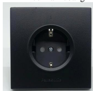
GAMBAR: ILUSTRASI STOP KONTAK

Saklar yang digunakan setara PANASONIC. Jumlah saklar menyesuaikan RAB/Drawing.