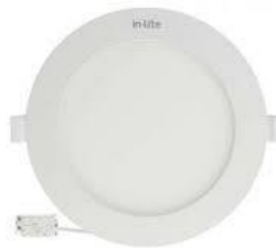
GAMBAR: ILUSTRASI LED DOWNLIGHT