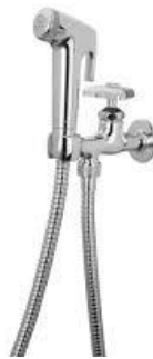
GAMBAR: ILUSTRASI JETSHOWER